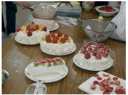
クリスマスケーキは皆で作ります。

少し遅れてきた私は、その熱気にたじたじとなり、「今日は大変なことになった！」とパーティーの盛り上がる予感があったのでした。早速私は、卓球台でできたテーブルの飾り付けを手伝い始めました。お昼も近くなり味里やかまど屋が、オードブルをもってやってきました。準備万端です。その時、実行