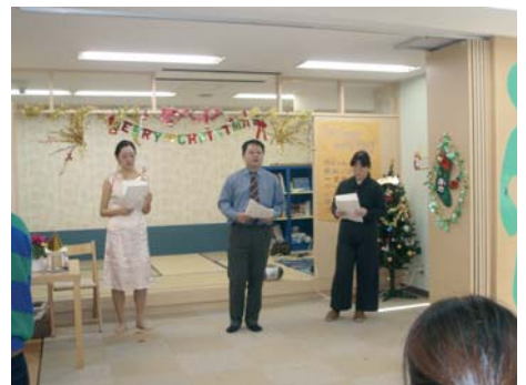
ゴスペル部の「アベ・マリヤ」

委員長のC君が開会の挨拶を始めたのでした。 しかしそれは、「そんなのかんけいねえー」を連発して何を言ってるのかさっぱりでした。しかしなぜか盛り上がるのでした。そして乾杯と同時に会食が始まりました。この日この時をひたすら待っていました。まずは、味里のオードブルから頂きます。唐揚げがおいしいのでした。焼きそばもまずま