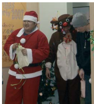
今年も来ましたサンタさん。

ビンゴ大会の後は、Nさんとスタツフイさんの初めての共同作業のケーキ入刀です。朝皆で作ったクリスマスケーキを皆で分け合うのです。甘いイチゴが鮮やかです。ここまで来るとクリスマスパーティーは、いよいよクライマックスです。後は、プレゼント交換を残すだけとなりました。今年は、番号札を引換券として渡して、プレゼント品の番号を読み上げるといふものです。ちなみに私には、ハンカチと五百円のテレフォンカードでした。（ありがとう！） そうこうしている間にPM3:00となり楽しいひとときもお開きの時間となりました。ここで実行委員長のC君の閉会の挨拶（また、何を言っているのか良く分かりませんでした）楽しい一日は、お開きとなったのでした。（F）