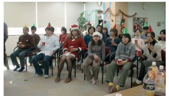
大勢のメンバーが集まりました。

新年あけましておめでとうございます。昨年中は、デイケア通信をご愛読下さいます。今年も張り切って紙面づくりをして参りますので楽しみにしてくださいね。 ところで、年末最後で最大の行事と言ったら、そうです。07.12.21のクリスマスパーティーです。 その日は朝からケーキづくりのため、みんな熱気にむんむんと包まれていました。おいしそうなイチゴのショートケーキと、ロールケーキを、生クリームを泡立て、デコレーションしました。