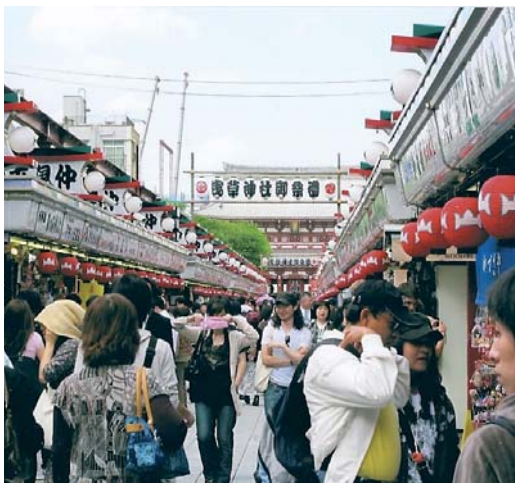
賑やかな仲見世通り

草に出たほうが、「快速電車でいいのでは」と思いましたけど、案外JRでもあつという間に新橋に着きました。