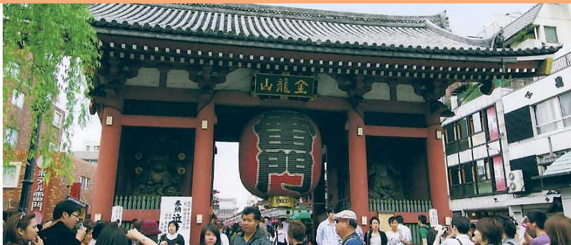
ご存知浅草のシンボル雷門